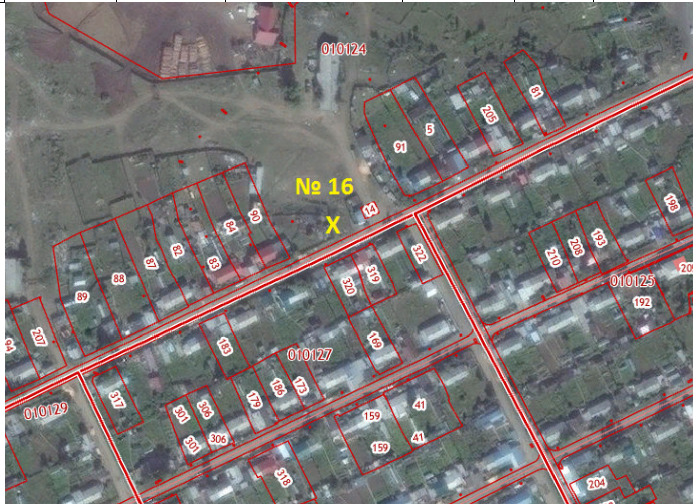
X – место размещения НТО, № 16 – номер в соответствии со схемой