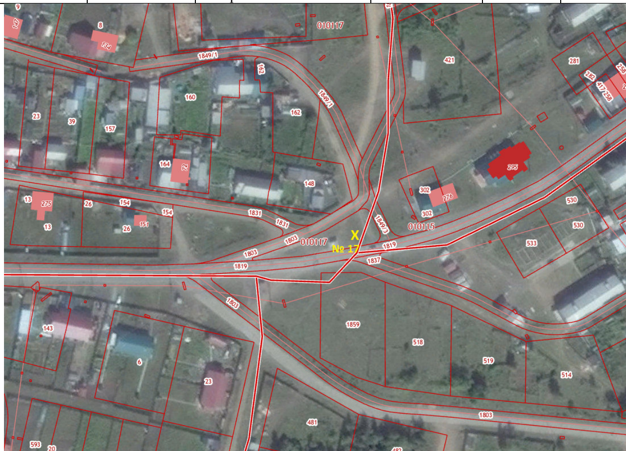
X – место размещения НТО, № 17 – номер в соответствии со схемой