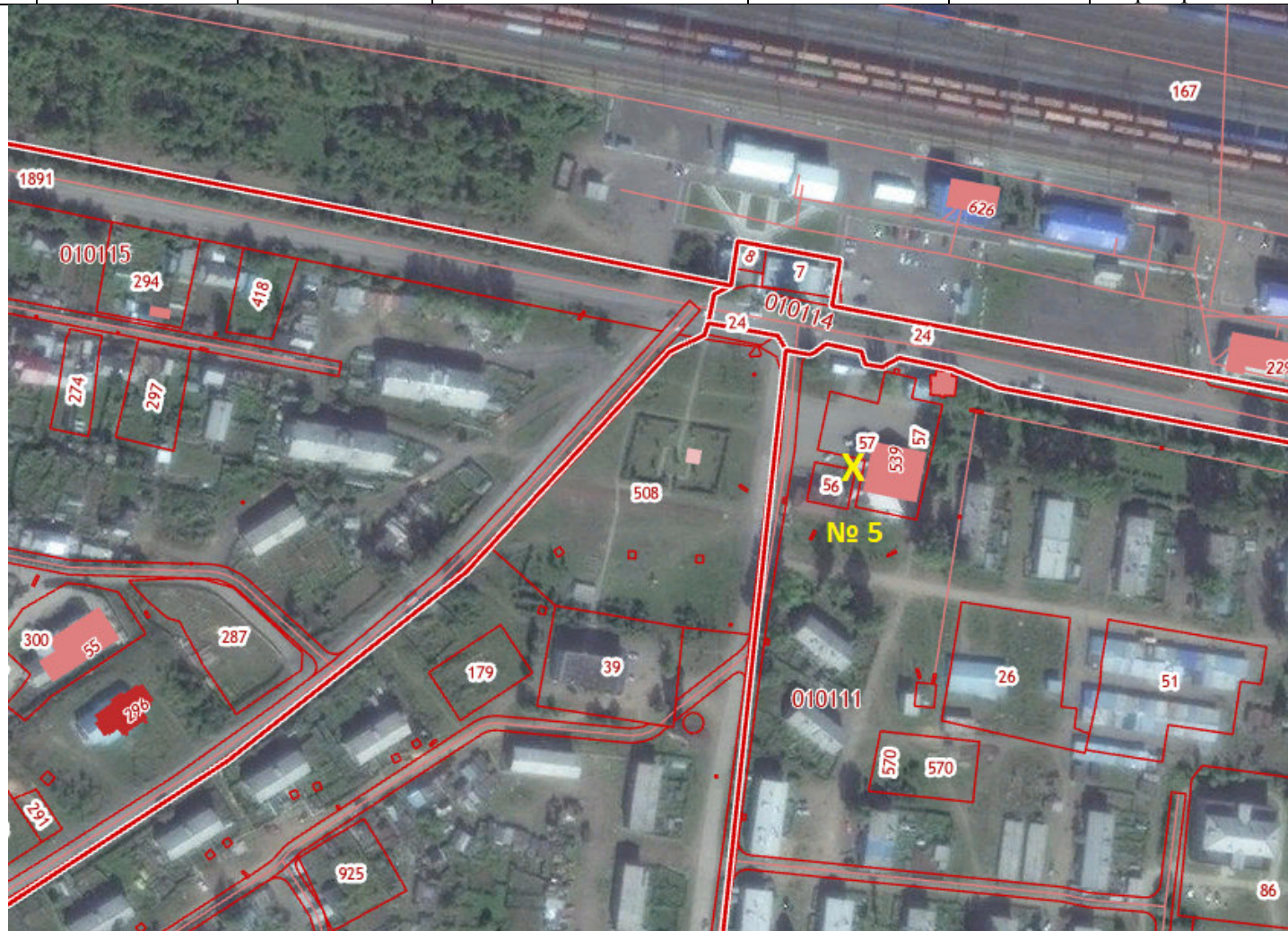
X – место размещения НТО, № 5 – номер в соответствии со схемой