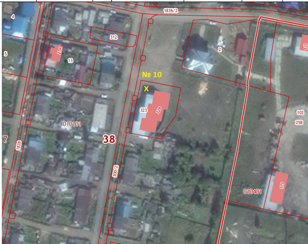
X – место размещения НТО, № 10 – номер в соответствии со схемой