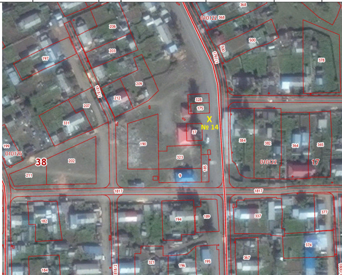
X – место размещения НТО, № 14 – номер в соответствии со схемой