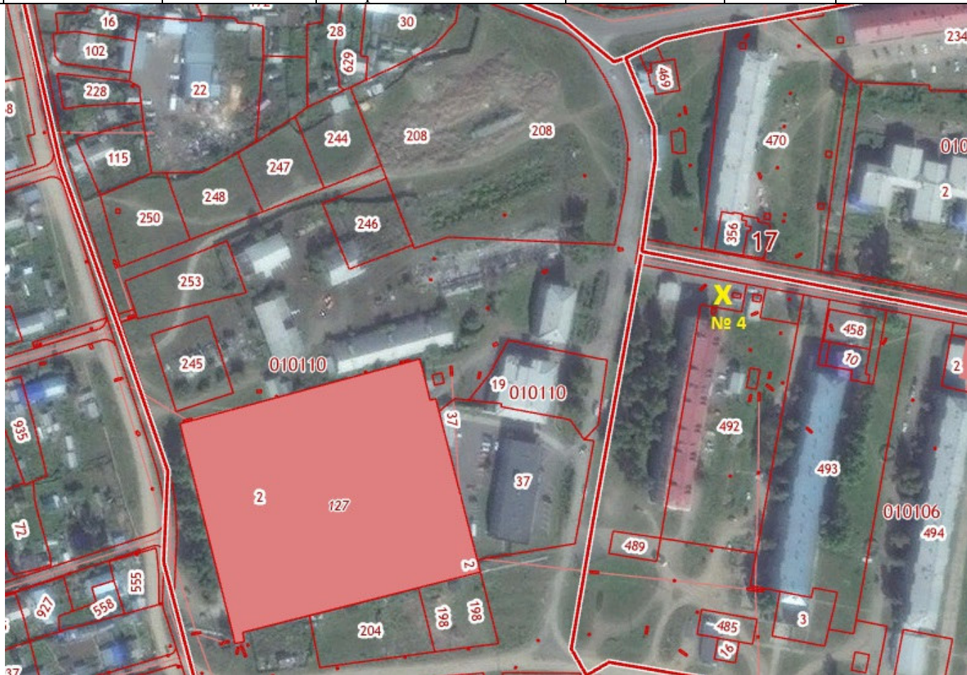
X – место размещения НТО, № 4 – номер в соответствии со схемой