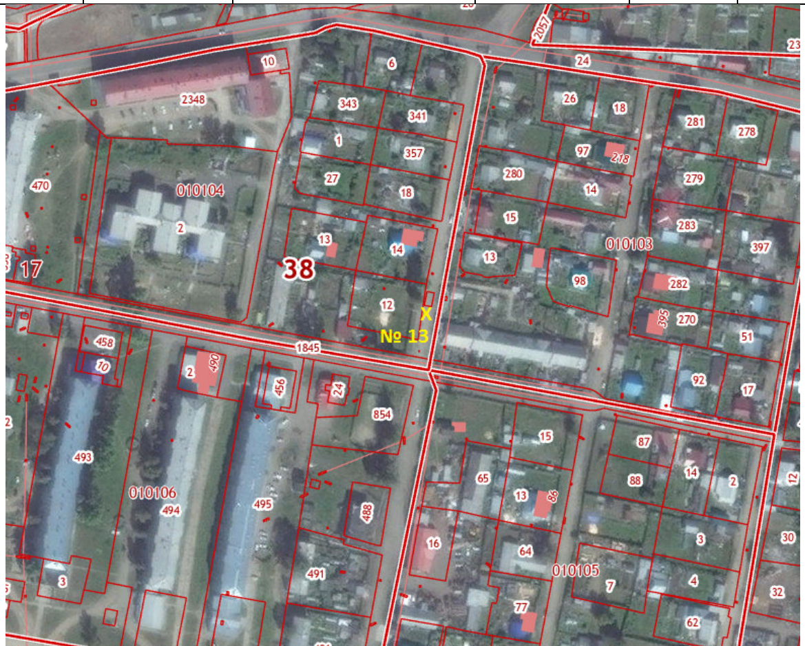
X – место размещения НТО, № 13 – номер в соответствии со схемой