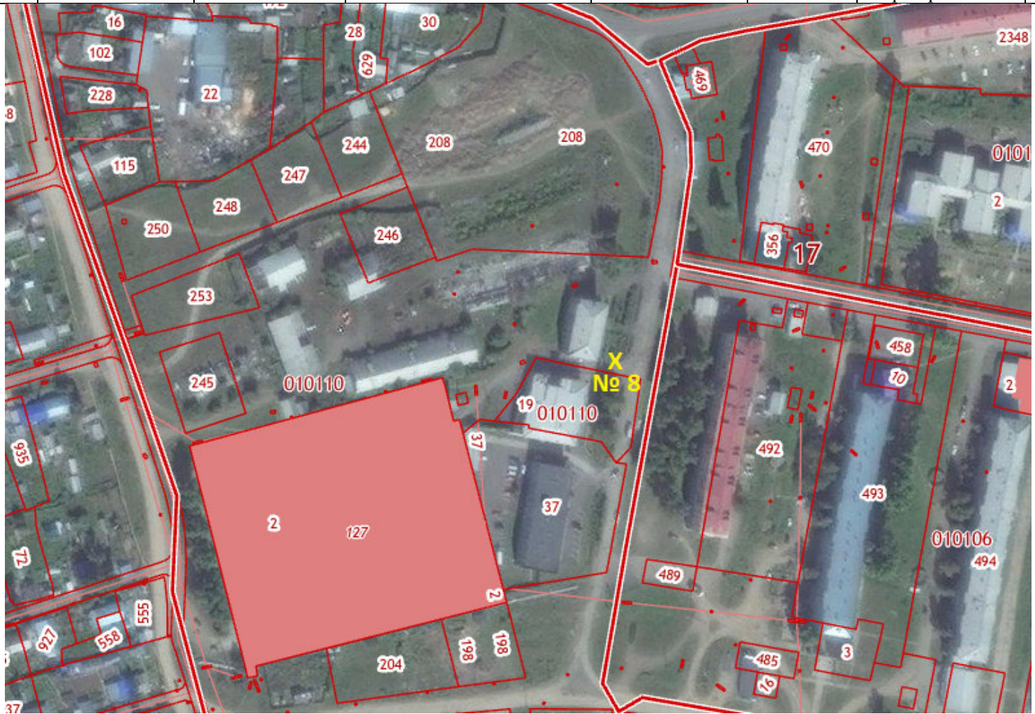
X – место размещения НТО, № 8 – номер в соответствии со схемой