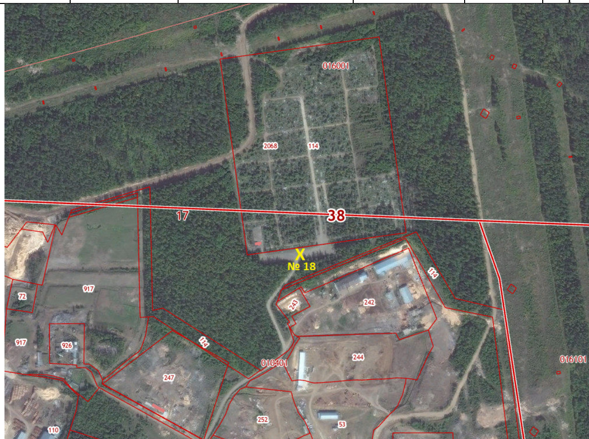
X – место размещения НТО, № 18– номер в соответствии со схемой