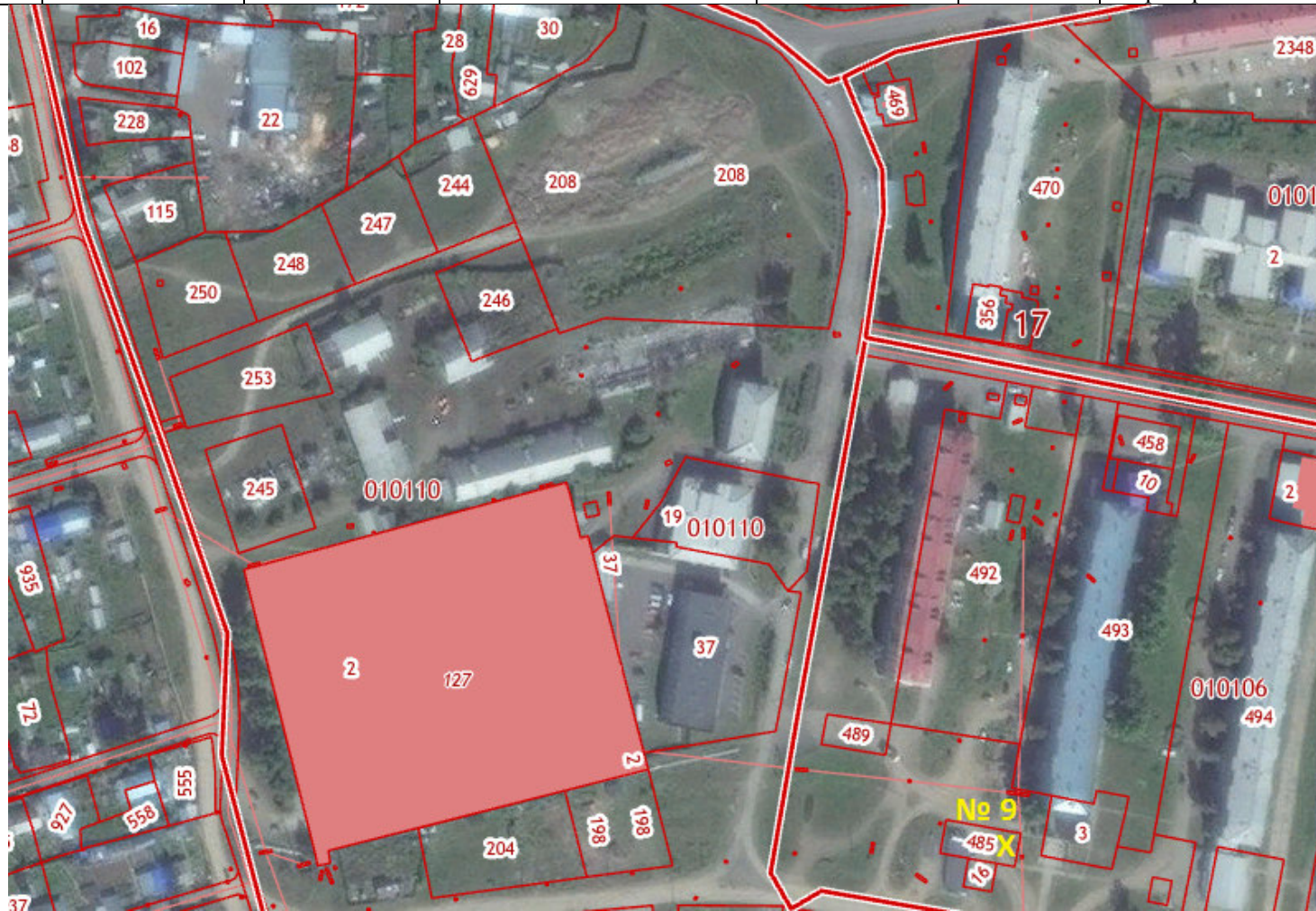
X – место размещения НТО, № 9 – номер в соответствии со схемой