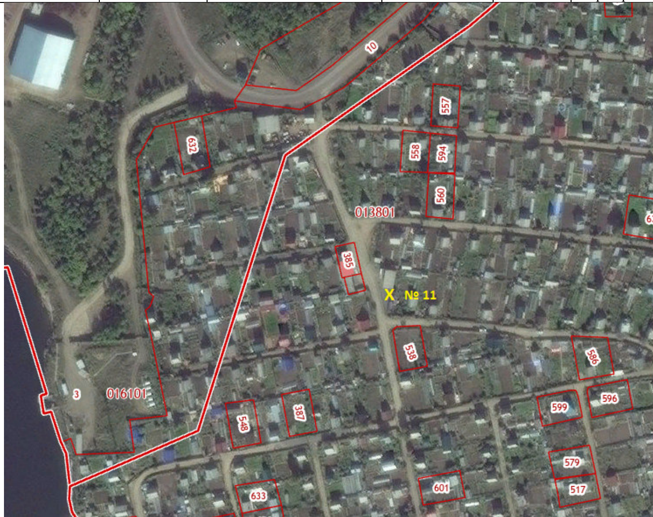
X – место размещения НТО, № 11 – номер в соответствии со схемой