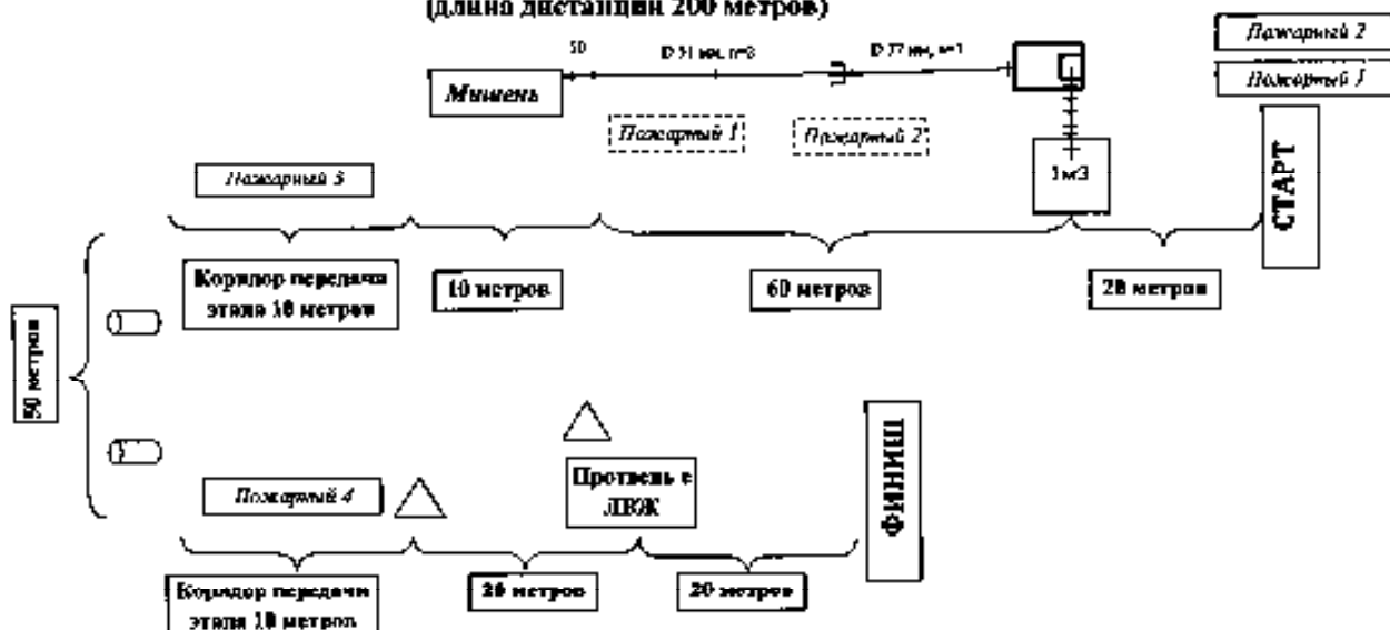
Схема проведения соревнования «Боевое развертывание и тушение условного пожара» (длина дистанции 200 метров)