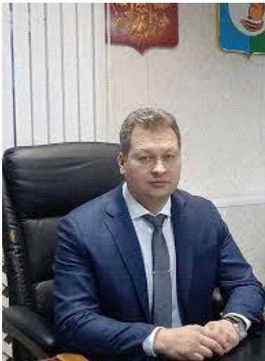
Макаров Яков Иванович Мэр муниципального образования «Усть-Илимский район» с 2014 года